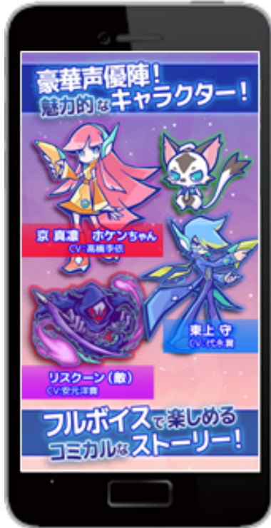
(1) 豪華声優陣を起用！