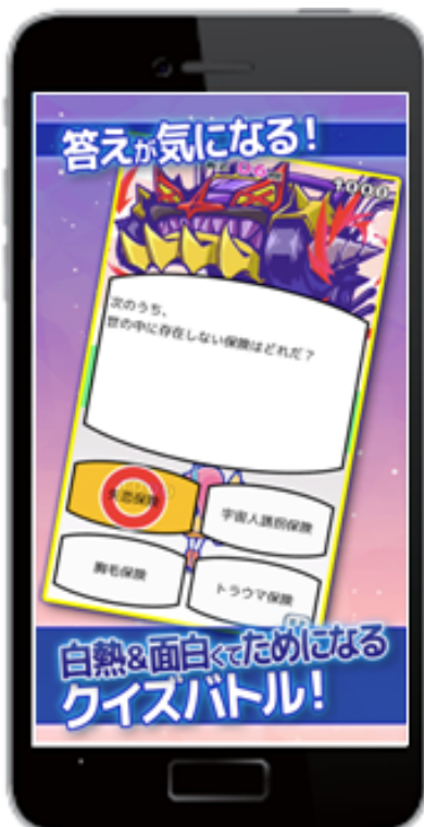
(3) 保険のクイズに正解して敵を倒せ!