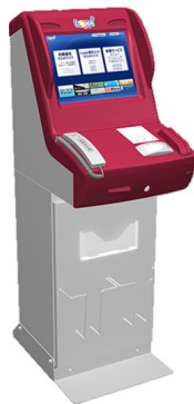
マルチメディア端末「Loppi」 (ローソン店舗内に設置)