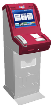
マルチメディア端末「MINISTOP Loppi」 (ミニストップ店舗内に設置)