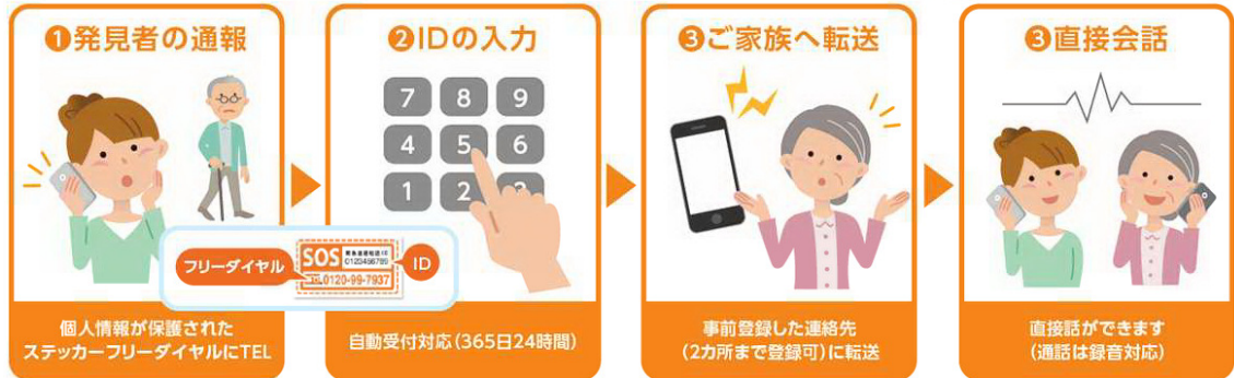
* SNL による「緊急連絡ステッカー」の解説図

行方不明になった後に発見・保護した方や緊急搬送先の医療関係者等がご家族に連絡しやすくするために、フリーダイヤルを記載した「緊急連絡ステッカー」を認知症の方の財布、携帯電話等に貼り付けていただきます。ICT(情報通信技術)により、発見・保護した方とご家族が互いの連絡先を非表示の状態ですぐに直接ご家族と通話することができます。