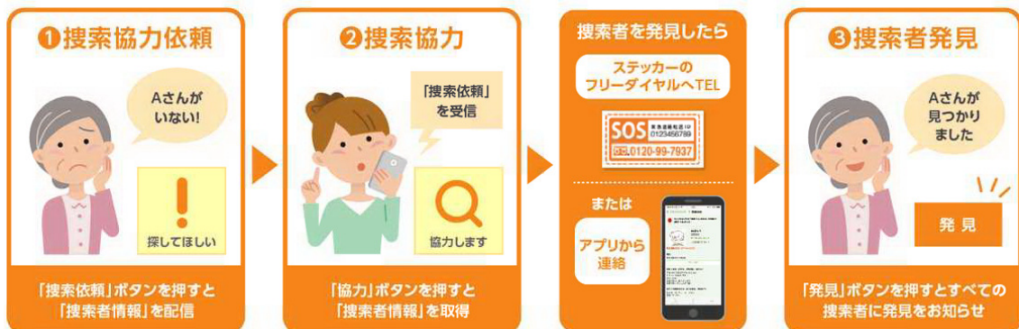
* SNL による「搜索協力支援アプリ」の解説図

行方不明時の搜索にご協力いただける方(搜索協力者)のスマートフォンにあらかじめアプリをダウンロードしていただきます。認知症の方のご家族が行方不明に気づいた際には、搜索協力者に同アプリを通じて一斉に搜索依頼ができます。これにより、早期対応、早期発見を実現します。