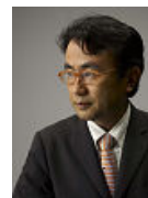
あんしんセエメエ 声：三谷幸喜氏

※新CMは、東京海上日動サイト「超保険スペシャルサイト」でも8月2日(月)～ご覧いただけます。