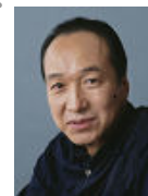
東京海ジョー 声：小日向文世氏

「損保と生保で一緒に保険を作る！」と掛け合いながら、「超保険」と書かれた垂れ幕を広げます。最後は勢い余って一緒に空を飛ぶシーンでユーモラスに終わります。