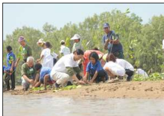
(写真：2008年2月タイでのマングローブ植林風景)

マングローブ林は、CO2を吸収し固定することにより地球温暖化を防止・軽減するとともに、津波等から人々を守る防波堤の役割を果たすなどの効果があります。当社は「地球の未来にかける保険」としてマングローブ植林事業を100年継続していくことを目指しています。