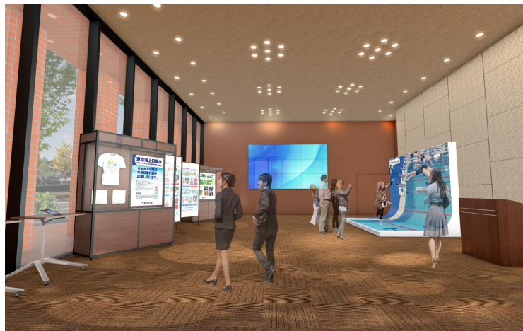
「チャレンジスクエア」イメージ図

今後、当社が東京2020オリンピック・パラリンピックのゴールドパートナー(損害保険)として、安心・安全な大会の実現に向けて貢献し、各界の皆様とともに、アスリート・人・社会の挑戦を支えたい、という思いを対外的に発信するとともに、様々なイベントを企画する予定です。