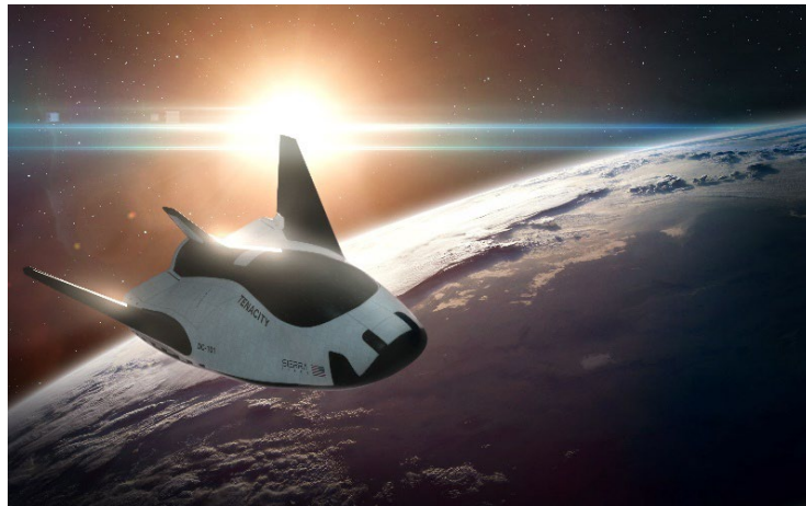
宇宙往還機 Dream Chaser イメージ

JAL、兼松、大分県、三菱 UFJ 銀行、東京海上日動、Sierra Space、Space Port Japan は、宇宙往還機 Dream Chaser®の活用検討に向けたパートナーシップ契約を締結しており、各者の連携のもと、大分空港を Dream Chaser のアジア拠点として活用することを目指し、実現に向けた取り組みを推進しています。