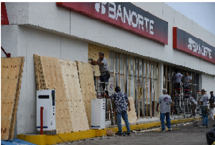
ハリケーン上陸に備える現地の様子