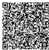
マリントップクス バックナンバー

本 Topics に関するお問い合わせ、ご意見、ご感想等ございましたら、弊社営業担当までお寄せください。編集にあたっては万全の注意を行っていますが、本 Topics 情報の正確性を保証するものではなく、これにより生じたいかなる損害に対して弊社は一切の責任を負わないものとします。