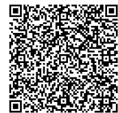
マリンピックアップ バックナンバー

編集にあたっては万全の注意を行っていますが、本 Topics 情報の正確性を保証するものではなく、これにより生じたいかなる損害に対して弊社は一切の責任を負わないものとします。