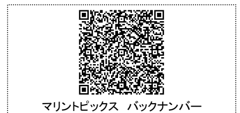
マリントピックス バックナンバー

本 Topics に関するお問い合わせ、ご意見、ご感想等ございましたら、弊社営業担当までお寄せください。 編集にあたっては万全の注意を行っていますが、本 Topics 情報の正確性を保証するものではなく、これにより生じたいかなる損害に対して弊社は一切の責任を負わないものとします。